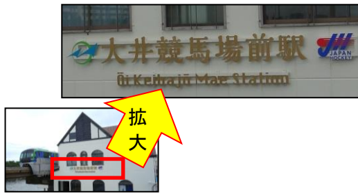
大井競馬場前駅北側外観に掲出されているJHAのロゴマーク