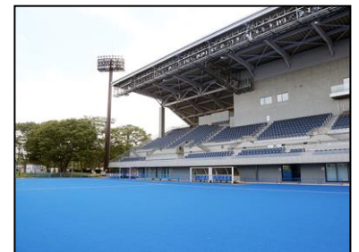
東京2020オリンピック・ホッケー会場 大井ホッケー競技場