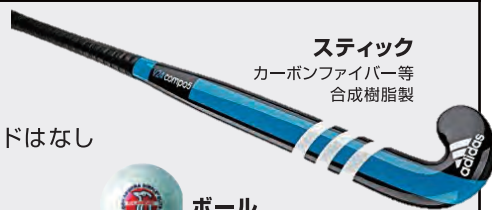
スティック カーボンファイバー等 合成樹脂製