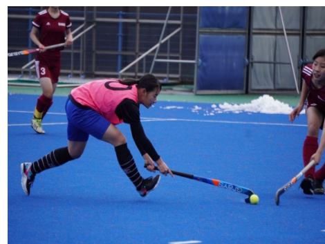
大会参加（Hiroshima Buena Vista CUP 2021新人ホッケー大会）