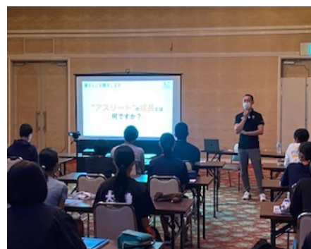
アスリートプログラム（埼玉）