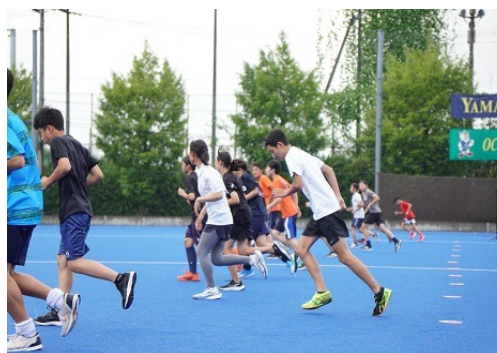
専門測定（シャトルラン）