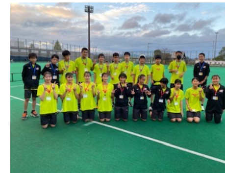
集合写真（適性検証/埼玉）