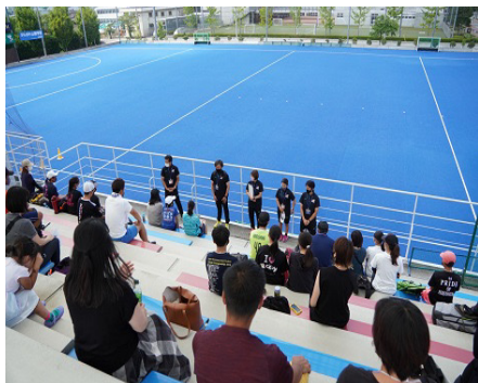
スタッフ挨拶（山梨）